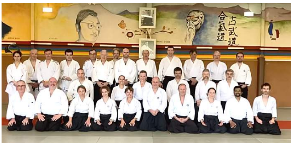
photo de groupe prise lors du stage.